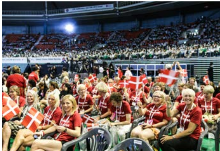
50 danske sygeplejersker og sygeplejestuderende deltog i ICN-konferencen i Seoul i 2015.

I arbejdet har det specielt været vigtigt at få tydeliggjort behovet for Advanced Practice Nurses. DSR har foreløbigt været i kontakt med Sundhedsstyrelsen og har fulgt op med yderligere kommentarer til høringen og arbejdet i et politisk spor rettet mod sundhedsministeren og de øvrige nordiske sundhedsministre i samarbejde med SSN.