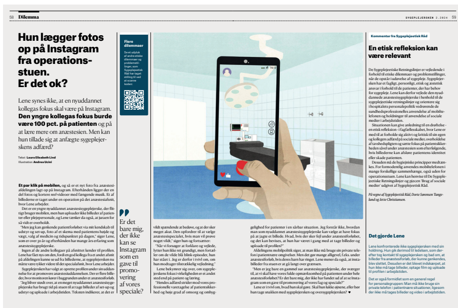
Eksempel på præsentation af et dilemma i fagbladet Sygeplejersken (nummer 2, 2024).

Det har gennem året været både etiske dilemmaer og etiske problemstillinger, der har været præsenteret. Sygeplejeetisk Råds medlemmer har med afsæt i De Sygeplejeetiske retningslinjer, etiske teorier samt evidens baseret viden, drøftet og kommenteret dilemmaerne og problemstillinger. Kommentarerne findes i tilknytning til det indsendte dilemma i fagbladet.